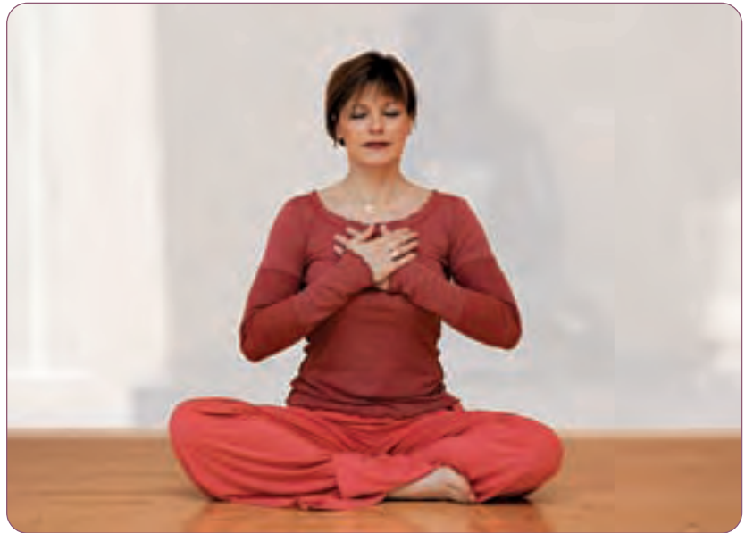
Beide Hände auf dem Herzen

Die Hauptursache für Leid und Kummer ist demnach die eigene Denkstruktur. Wir wollen Recht haben, identifizieren uns mit festgefahrenen Meinungen und halten Vorurteile aufrecht, ohne sie zu überprüfen. Ziel soll es nach Patanjali nicht sein, sich alles schönzudenken, sondern aus einer angemessenen Distanz wertfrei zu beobachten und dadurch ein besseres Verständnis zu entwickeln. Öffnet sich das Herz für die Dinge, wie sie sind, werden wir