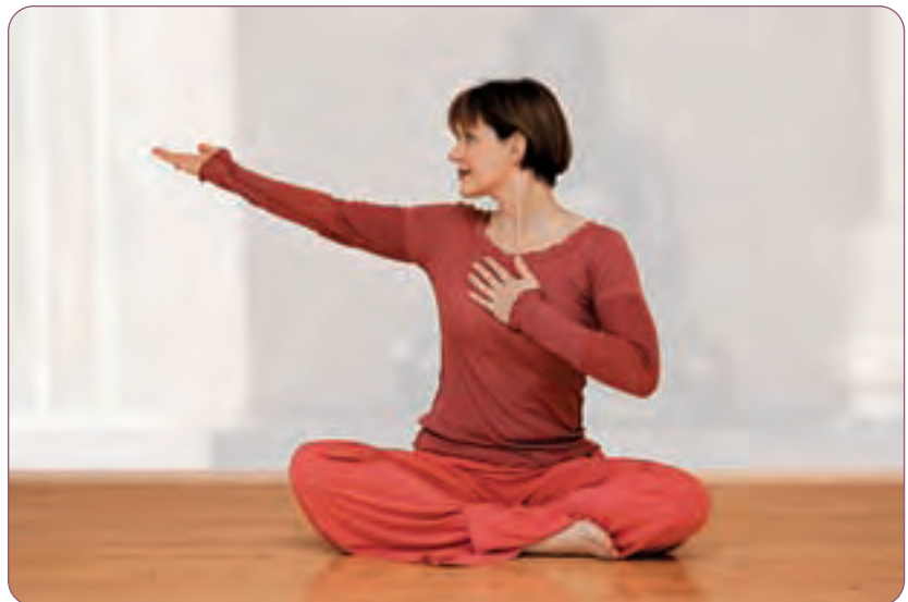
Arm zu Seite geführt