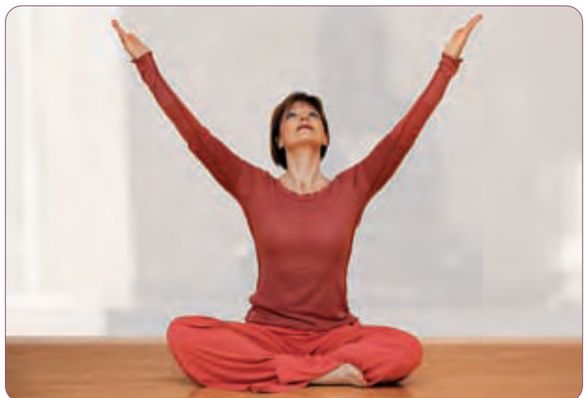
Arme weit geöffnet